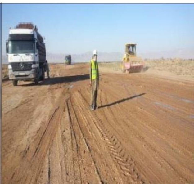
Clearing and Grubbing (8+350 to 8+700)