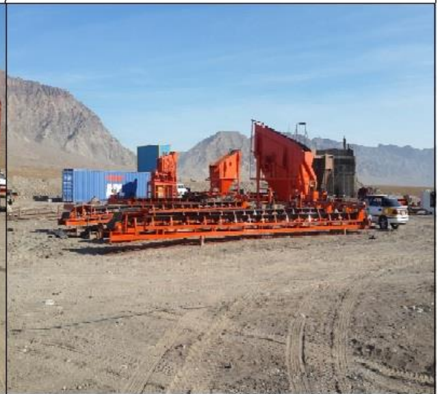
Installation of Crush Plant