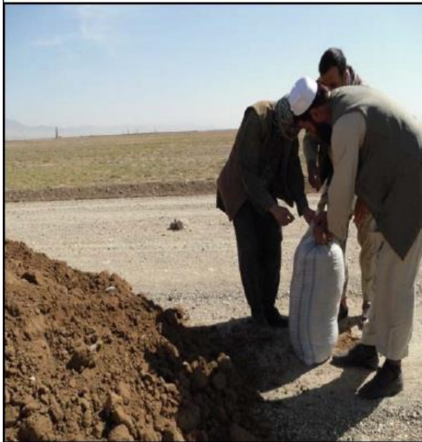
Resampling from the Existing Road