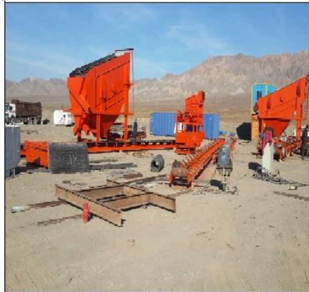
Installation of Crush Plant