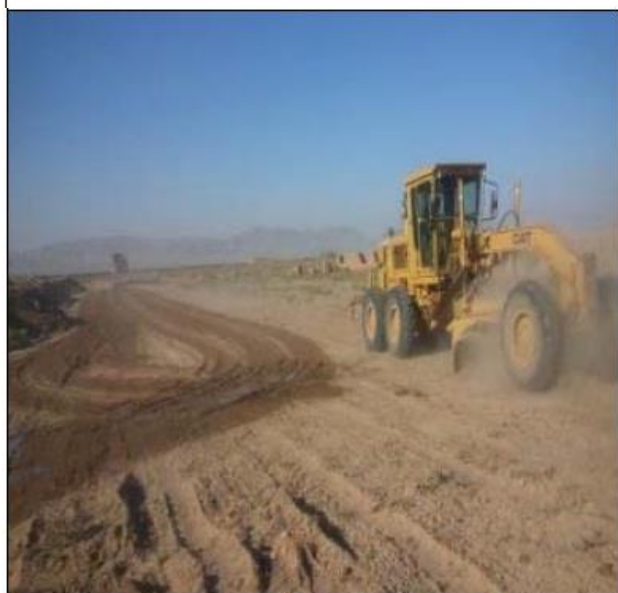
Clearing and Grubbing (8+000 to 8+350)