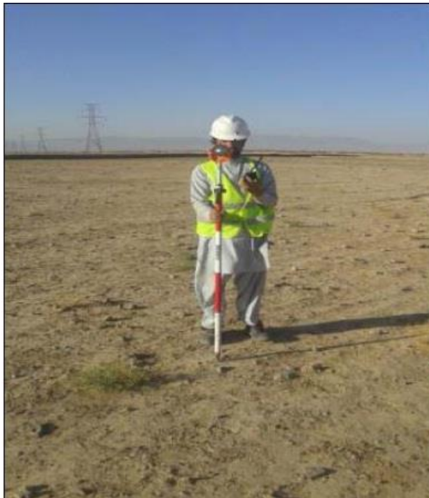
Stake out and Alignment of the road (8+500 to 9+000)

فعالیت های که در ساحه عملا " جریان دارد: