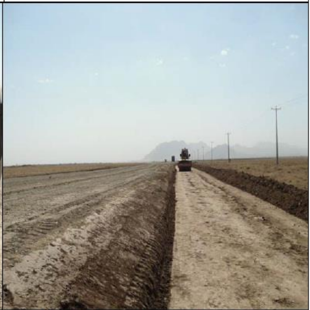
Making NGC of side road (0+000 to 3+000)