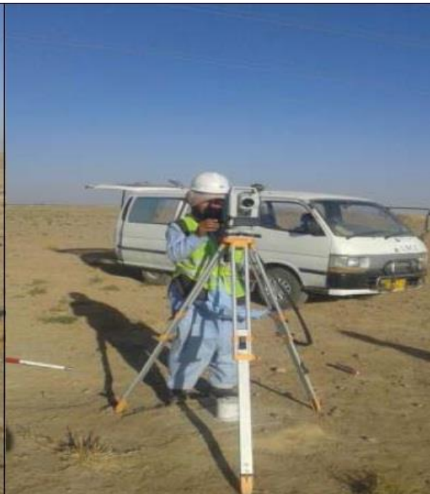
Stake out and Alignment of the road (9+000 to 9+800)